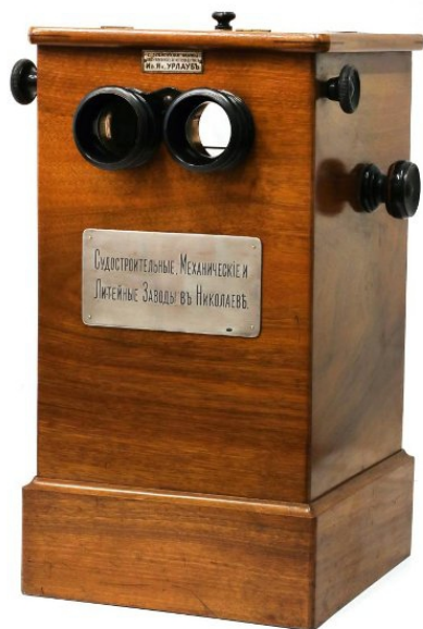
Стереоскоп. 1904 год