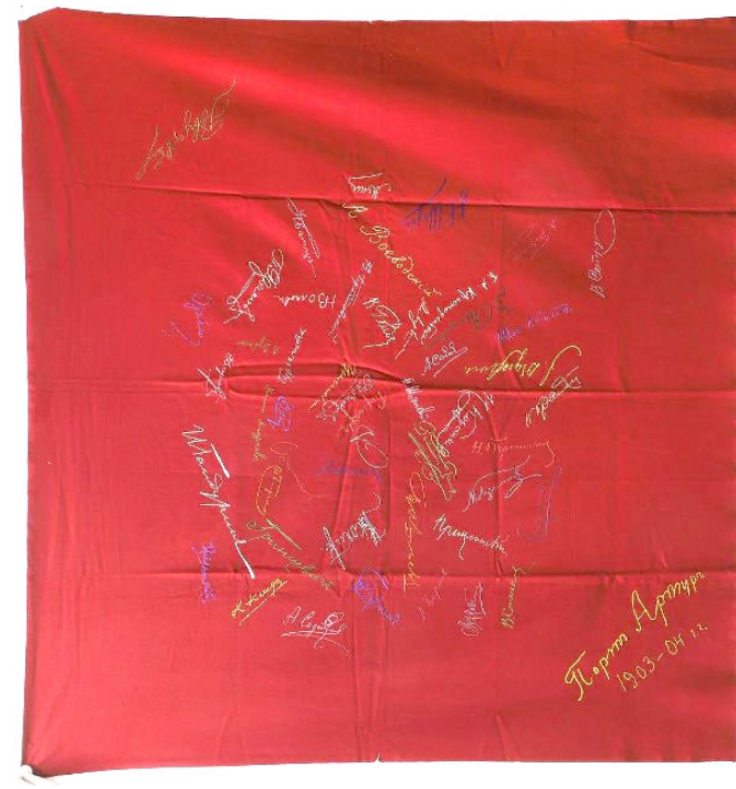
Скатерть из госпиталя Порт-Артура с автографами русских офицеров. 1903–1904 годы

Осажденный Порт-Артур героически защищался до декабря 1904 года, отражая ожесточенные штурмы японцев; 2 (15) декабря был убит генерал Р.И. Кондратенко, бывший душой обороны, а 20 декабря 1904 года (2 января 1905 года по новому стилю) командовавший русскими войсками генерал А.М. Стессель сдал крепость японцам, вследствие чего японская осадная армия могла быть переброшена на Маньчжурский фронт.