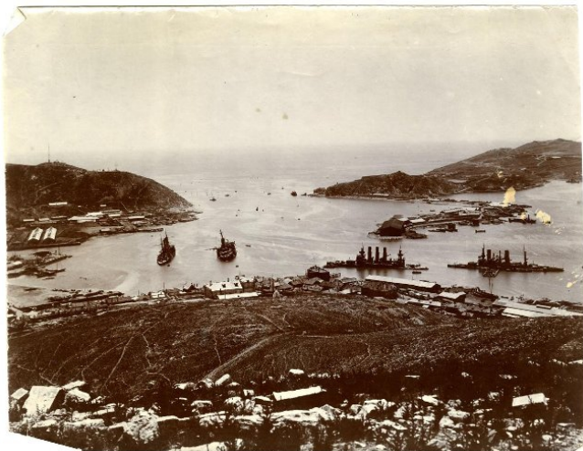
Внутренний рейд Порт-Артура. 1904 год

В 1902 году Япония, заключив союз с Великобританией, начала готовиться к войне. Японцы протестовали против русских предприятий в Корее и требовали эвакуации всех войск и предпринимателей к концу 1903 года. Не добившись уступок, японское