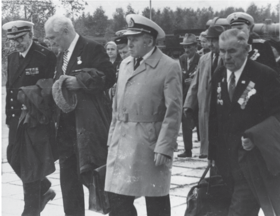
Встреча ветеранов в филиале «Дорога жизни». 12.09.1976

9 мая 2015 года, построено здание для открытого хранения крупногабаритных экспонатов, новая набережная, проведено озеленение и дополнена экспозиция на открытом воздухе. Проведена масштабная реставрация автомобиля ГАЗ-АА и самолета Ли-2. К Дню Военно-Морского Флота закончено строительство современного здания музея, административно-бытового комплекса, павильона для катера Ладжской военной флотилии типа МО-4. Были закончены работы по обновлению и ремонту буксира «Ижорец № 8»,