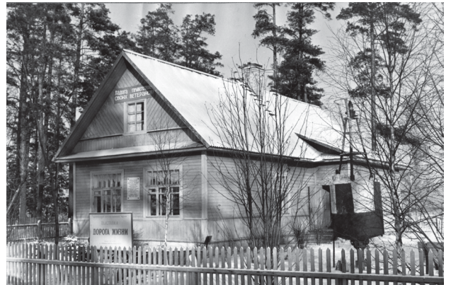
Здание Осиновецкой школы, в котором размещалась выставка «Дорога жизни». 1970