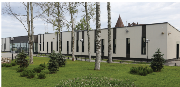
Здание администрации и мультимедийного комплекса, май 2016