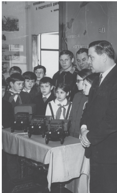
Вручение моделей автомобилей ГАЗ-АА делегацией Горьковского автозавода. 10 февраля 1973 года

приняты на временное хранение ряд экспонатов из Военно-исторического музея артиллерии, инженерных войск и войск связи и Государственного мемориального музея обороны и блокады Ленинграда в рамках совместных проектов. В работе над созданием нового музейного комплекса «Дорога жизни» принимали участие Управление культуры Министерства обороны РФ, ООО «Евро-Люкс», ООО «ГУОВ» ЗВО, ООО «Строй Инвест», ООО «Ремфасад», ООО «Кронштадт Технологии», ООО «Лазком плюс», ООО «Арсенал», ООО «Ария», АО «Адмиралтейские верфи».