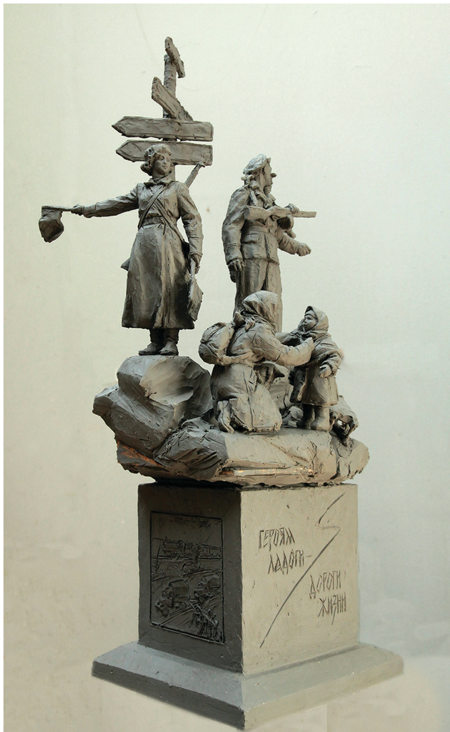
Модель памятника, посвященного героям Ладоги на Дороге жизни