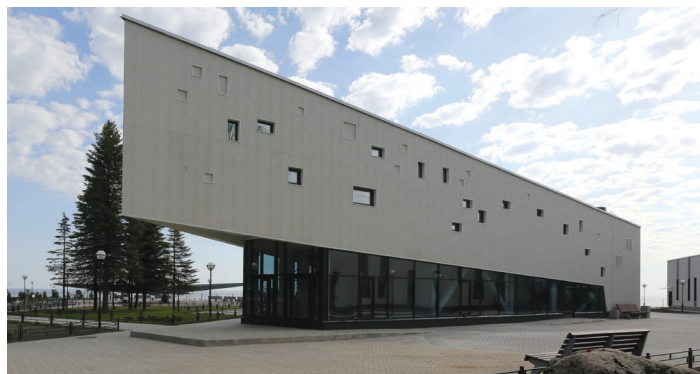
Здание музейной экспозиции филиала ЦВММ «Дорога жизни», май 2016

Вне всяких сомнений этот кропотливый и творческий труд принес нашему сплоченному коллективу много интересных экспозиционных решений и научных открытий.