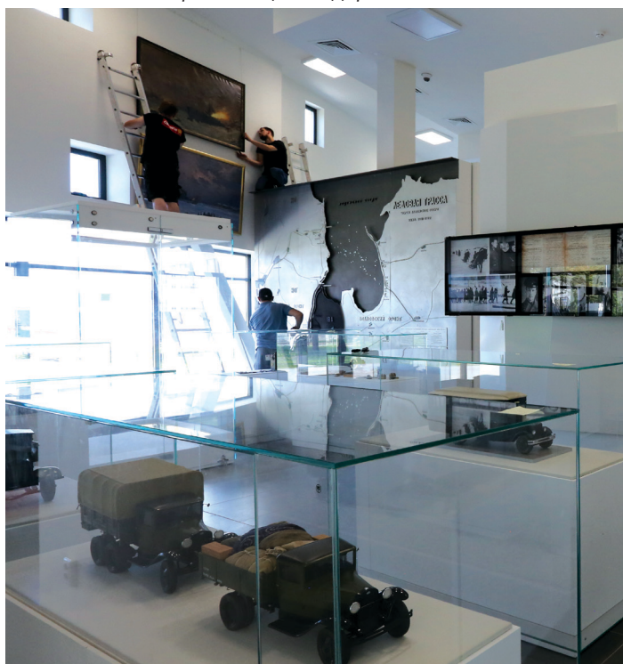
Монтажные работы в залах новой музейной экспозиции, июнь 2016