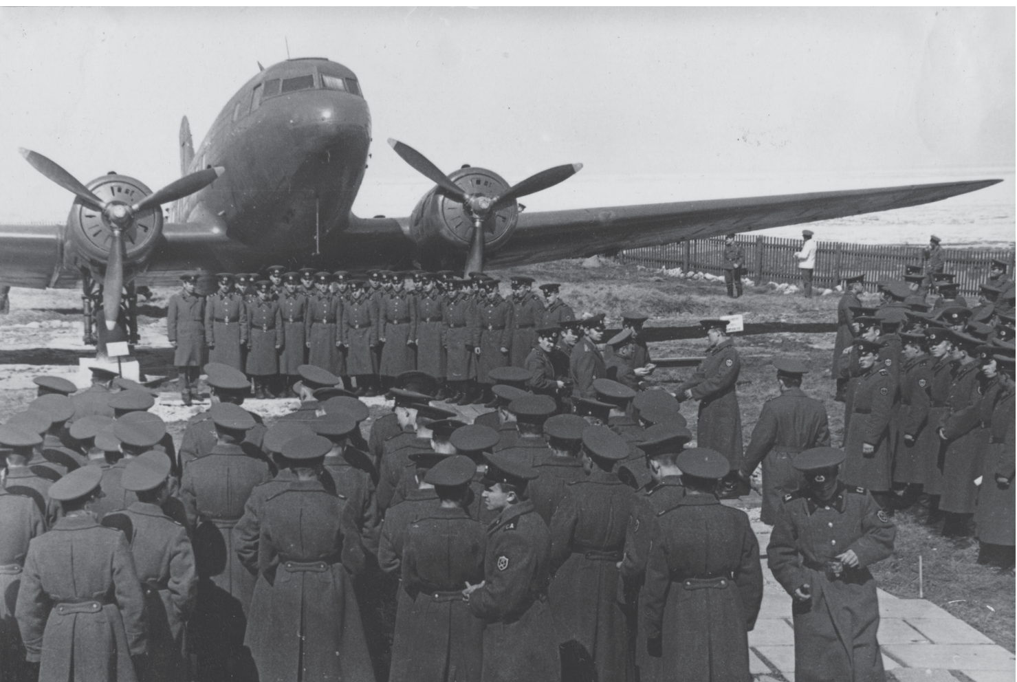
Одно из массовых мероприятий, проводившихся ежегодно в филиале ЦВММ «Дорога жизни» командованием воинских частей (приведение к присяге, вручение погон младшим командирам, празднование исторических дат и т. д.). После 1973

К 70-летию Победы в Великой Отечественной войне было принято решение о полной реконструкции территории филиала «Дорога жизни». К открытию реконструированного музейного комплекса.