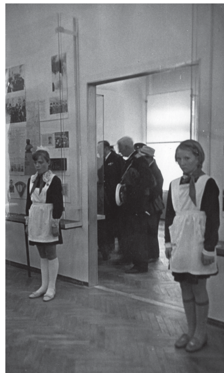
Пионеры Вагановской школы в почетном карауле в день открытия музея. 12 сентября 1972 года