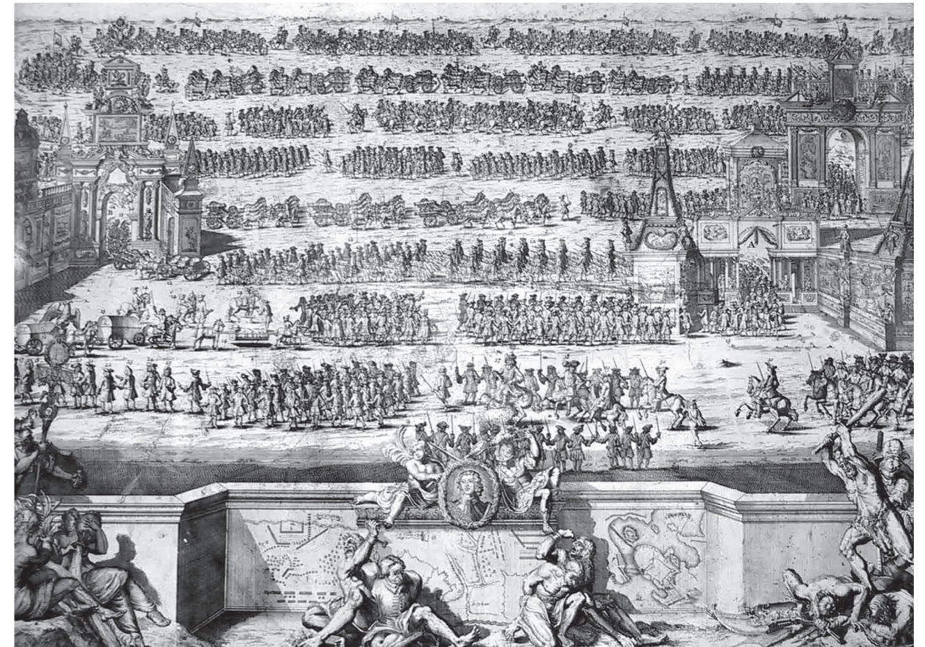
П. Пикарт. Торжественный въезд Петра в Москву после Полтавской битвы. 1711